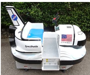
ひこうきくん・シャトルくん